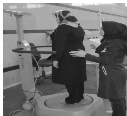
شکل ۲- بیمار مبتلا به MS حین اجرای آزمون روی تعادل سنج

شرکت‌کنندگان ۴ کوشش ۱۵ ثانیه‌ای را با ۱۰ ثانیه استراحت بین هر کوشش اجرا کردند (۴). در طول مدت اجرای آزمون