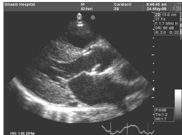
شکل ۲- تصویر اکوکاردیوگرافی داپلر بافتی (TDI) از قسمت بازال سپتوم نشاندهنده اختلال شدید عملکرد دیاستولیک