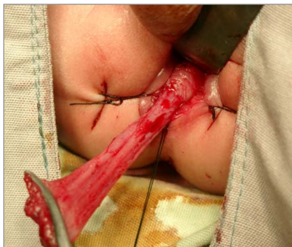
شکل ۱- موکوزکتومی کامل رکتوم انجام شده، قسمت سروموسکولار در پروگزیمال مشخص می باشد.

عدم وجود سلول گانگلیونر مورد مطالعه قرار گرفت و پس از تأیید آگانگلیونیک بودن (تأیید تشخیص هیرشپروننگ) برش فلپ مخاط در سطح قدامی هم کامل گردید. جدا کردن در قسمت زیر مخاطی تا حد رفلکشن پریتون انجام گرفت (۸-۱۰ cm). سطح سروزال و عضلات رکتوم قطع شد و با ورود به کاویته شکم، ادامه حذف روده بزرگ به صورت تمام ضخامت ادامه یافت (شکل ۱، ۲).