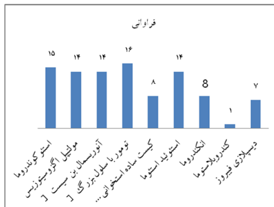
نمودار ۲- محل تومور