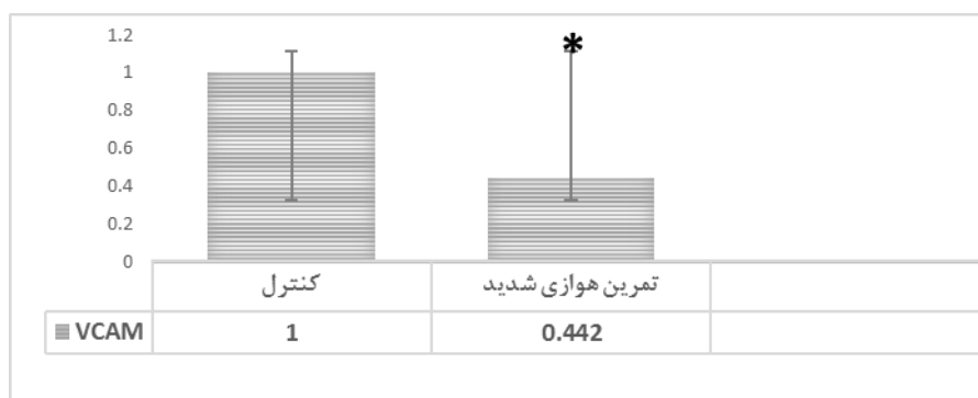
نمودار ۲- مقایسه ژن VCAM-1 بافت قلب دو گروه کنترل و تمرین هوازی شدید