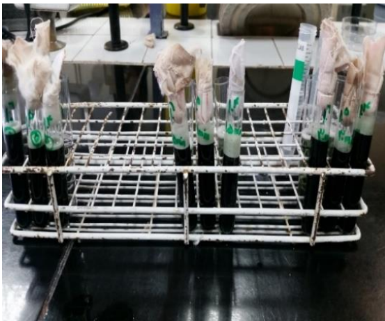
شکل ۱. مجاورت محلول ضد عفونی کننده و محلول اسپور باسیلوس سوبتیلیس

می‌باشد. سپس برای تهیه سوسپانسیون حاوی اسپور با غلظت‌های 10^6 CFU/mL و 10^5 و 10^4 ، سوسپانسیون نیم مک فارلند به ترتیب ۱۰۰ و ۱۰۰۰ و ۱۰۰۰۰ در آب مقطر استریل رقیق گردید. این سوسپانسیون در بن ماری ۲۰ درجه سانتیگراد به مدت ۲ ساعت پایدار است. بلافاصله بعد از آماده سازی و درست قبل از آزمون، به منظور نشان دادن عدم حضور سلول‌های رویشی و اسپورهای درحال رویش، آزمون میکروسکوپی انجام گردید. یک سی سی از هر کدام از غلظت‌های تهیه شده اسپور باسیلوس سوبتیلیس با ۸ سی سی از محلول ضدعفونی مخلوط گردید و زمان‌های تماس بر طبق پروتوکل ۵ دقیقه و ۱۵ دقیقه و ۳۰ دقیقه در نظر گرفته شد (شکل ۱). پس از گذشت زمان موردنظر، جهت خنثی سازی اثر محلول ضدعفونی کننده، یک میلی لیتر از مخلوط ضدعفونی و اسپور با ۹ میلی لیتر از خنثی کننده (محلول گلیسین ۲۵ گرم در لیتر) مخلوط گردید. زمان و دمای مورد نیاز برای مجاورت خنثی کننده و مخلوط ضدعفونی و اسپور به ترتیب ۵ دقیقه و ۲۵ درجه سانتیگراد در نظر گرفته شد. در مرحله بعد یک میلی لیتر از هر یک از غلظت‌های تهیه شده با ۱۵ میلی لیتر از محیط مولر هینتون آگار که پس از اتوکلاو گذاری به دمای ۴۵ درجه سانتیگراد رسیده داخل پلیت استریل ریخته شد و پلیت‌ها به مدت ۳ روز در دمای ۳۰ درجه سانتیگراد انکوبه گذاری گردید.