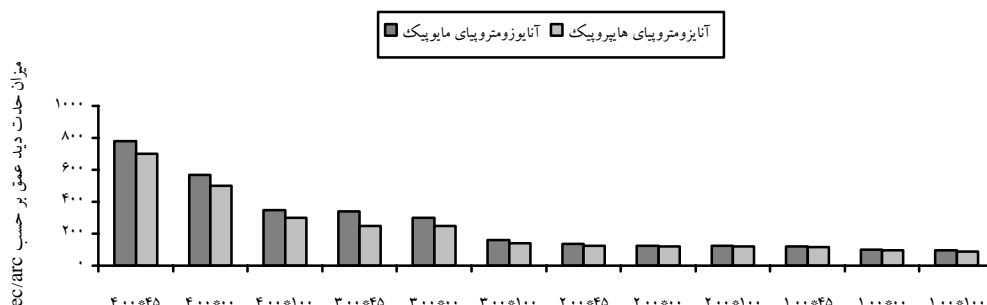
نمودار ۲- مقایسه میزان میانگین حدت دید عمق در مقادیر مختلف آنایزومتروپای ایجاد شده مایوپیک و هایپروپیک با تست تیموس