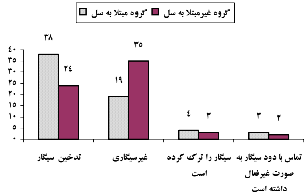
نمودار ۱- مقایسه فراوانی گروه های مورد مطالعه

۳۷/۵٪ در گروه شاهد سیگاری بوده اند و ۵۴/۷٪ هیچ گونه تماسی با سیگار نداشته اند (نمودار ۱) که این اختلاف در سطح ۰/۰۵ با استفاده از آزمون دقیق فیشر معنی دار بوده است (P- value = ۰/۰۳۲).