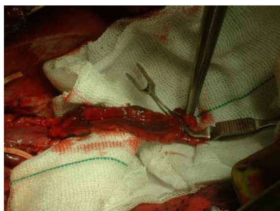
شکل ۲ - ریما (RIMA)

چسبندگی و عروق کوچک متعددی در قسمت فوقانی توراکس و در محل شریان بی نام ۳ راست و شریان سابکلایین وجود داشت. با توجه به شرایط فوق در حین عمل، اقدام بر آزاد سازی شریان اینترنال توراسیک راست با تکنیک مشابه آماده سازی شریان جهت انجام عمل با پاس کرومر شد. قطر شریان اینترنال توراسیک راست حدوداً ۵ mm بود که تقریباً معادل قطر شریان پولمونر راست بود (شکل ۲).