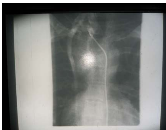
شکل ۱ - آرتروگرافی باریمای (RIMA) بزرگ تمایز یافته

ایجاد شنتهای سیستمیک - پولمونر به عنوان شنتهای تسکینی در بهبود وضعیت عمومی بیماران مبتلا به بیماری سیانوزدهنده قلبی مؤثر بوده است. استفاده از شریان توراسیک داخلی برای ایجاد شنت سیستمیک - پولمونر برای اولین بار در سال ۱۹۸۴ توسط کوبانوگلو ۲ و همکاران گزارش شده است (۱). در این گزارش دختر ۱۵ ساله‌ای معرفی می‌گردد که در عمل وی از شریان اینترنال توراسیک جهت ایجاد شنت سیستمیک - پولمونر استفاده شده است پس از آن که شنت اولیه که به روش اصلاح شده بلالک - توسیگ برای بیمار تعبیه شده بود، کارآیی مناسبی نداشت.