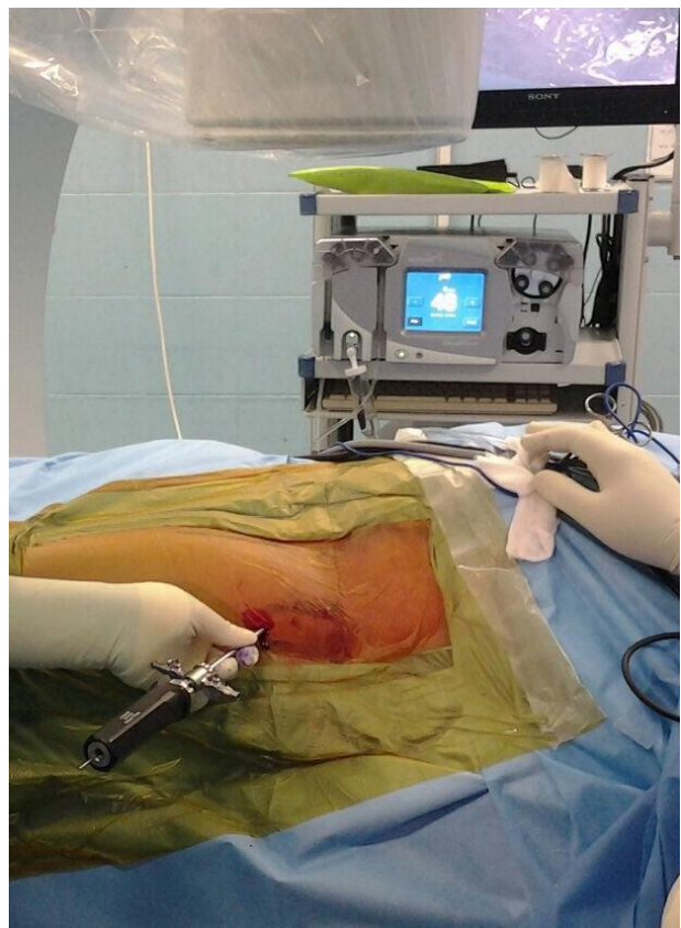
تصویر ۴- تعبیه پورتال آنترو لترال

معمولا دو پورتال بسیار مهم آنترو لترال و آنتریور هستند که تمامی جراحان در شروع عمل این دو را حداقل ایجاد می کنند. پورتال آنترو لترال معمولا انتخاب اول همه جراحان است و دسترسی بسیار خوبی به کمپارتمان پیرامونی مفصل هیپ می دهد و به محل اتصال سر و گردن فمور هم در دسترس است (تصویر ۴).