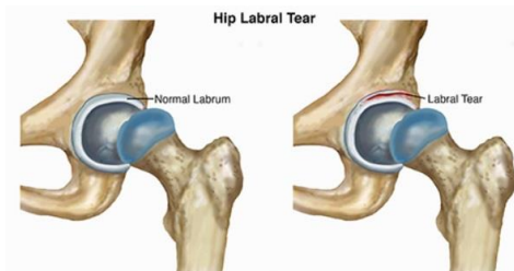
تصویر ۱. نمای شماتیک جایگاه لبروم

برخلاف افراد مسن که منشا عمده دردهای هیپ در آنها استئوآرتریت مفصل هیپ می باشد، در جوانان یک علت بسیار شایع درد هیپ اختلالات لبروم می باشد (۱). لبروم یک بافت فیبری- غضروفی است (تا حدودی مشابه منیسک در زانو) که لبه استابولوم را می پوشاند و نقش بسیار زیادی در سلامت مفصل هیپ و بیومکانیک آن دارد (تصویر ۱).