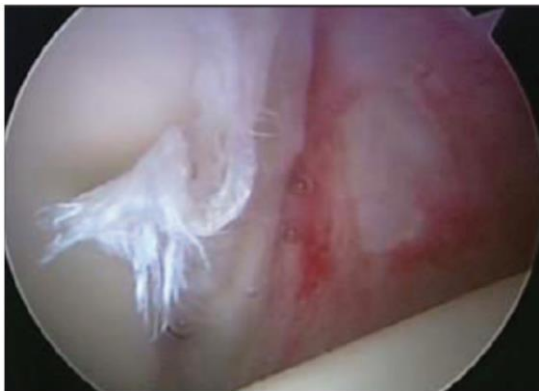
تصویر ۵- کمپارتمان مرکزی و نمای لبروم

برای ترمیم لبروم لازم است که حداقل دو میلیمتر از ضخامت غضروف مفصلی باقیمانده باشد یا به عبارت دیگر آرتروز مفصل هیپ در صورت وجود نبایستی پیشرفته باشد. پس از وارد شدن به کمپارتمان مرکزی هیپ هرگونه پارگی بایستی پروب شود تا مشخص شود که ناپایدار می باشد یا خیر (تصویر ۵).