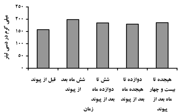
نمودار ۱ - میانگین کلسترول سرم بر حسب زمان آزمایش

بودند. به منظور مقایسه چربی های خون برحسب زمان انجام آزمایش، میانگین کلسترول و تری گلیسرید در زمانهای مختلف با یکدیگر مقایسه شد و نتایج آن در نمودارهای شماره ۱ و ۲ درج شده است. براساس نتایج مندرج در این نمودارها کلسترول خون در زمانهای مختلف با یکدیگر تفاوت آماری معنی داری داشت ( p<0/001 )، اما تری گلیسرید در زمانهای مختلف تفاوت آماری معنی داری با یکدیگر نداشت ( p=0/09 ). چنانچه صرفاً کلسترول و تری گلیسرید قبل و بعد از پیوند با یکدیگر مقایسه شود تفاوت آماری معنی داری دیده می شود (در هر دو مورد p<0/001 ).