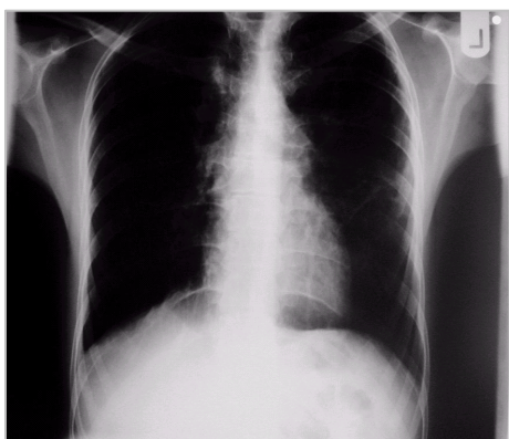
شکل ۲ - رادیولوژی زمان ترخیص بیمار

بیمار پس از آن با درمان طولانی مدت پیشگیرانه کوتریموکسازول دو قرص روزانه و توصیه به تجویز گاماانترفرون مرخص گردید. هم اکنون ۶ ماه از ترخیص بیمار می گذرد. بیمار از گاما انترفرون استفاده می کند و مشکلی در طول این مدت از نظر عفونتها نداشته است. در شرح حال فامیل بیمار خواهر بیمار نیز از عفونتهای جلدی آبه مانند مکرر رنج می برد. که توصیه به انجام آزمایش نیتروبلوترازولیوم جهت احتمال ابتلا به گرانولوماتوز مزمن شد.