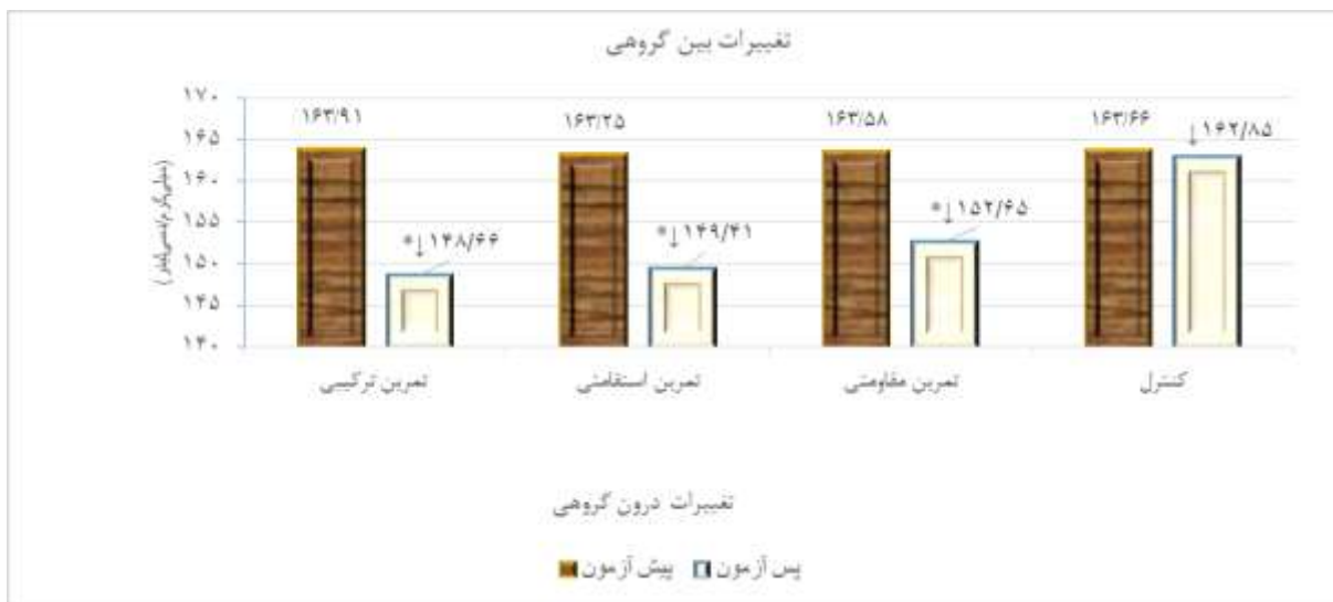
نمودار ۲. بررسی تغییرات میانگین درون گروهی و بررسی تفاوت‌های بین گروهی